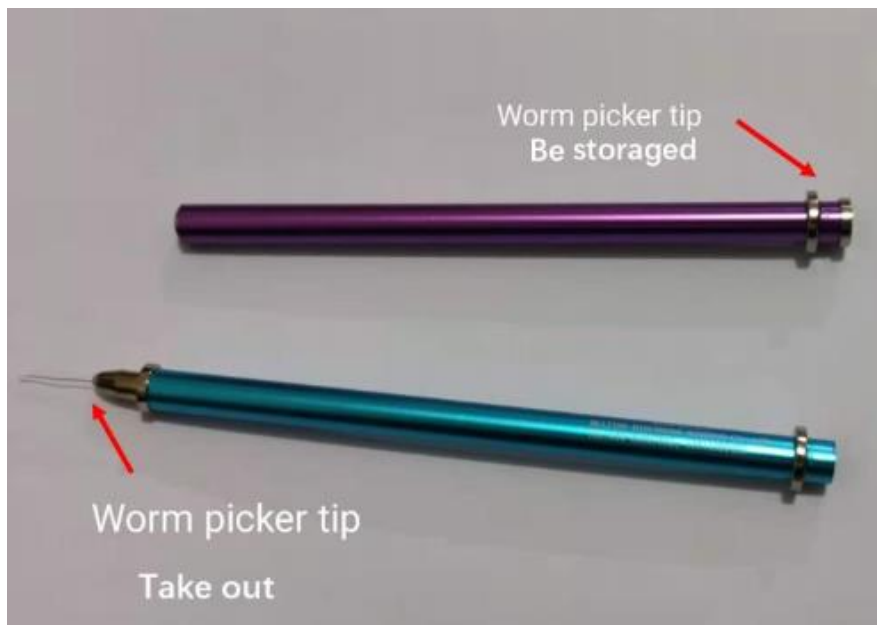
太空铝杆 worm picker (黑色、天空蓝、紫荆紫三色可选)